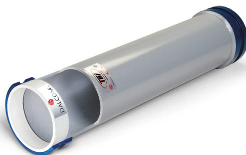
Esempio di tubo sezionato.